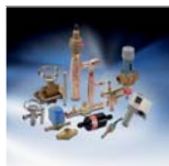
Регуляторы коммерческих холодильных установок

ние на качество наших изделий, компонентов и систем, которые являются основой повышения эффективности работы и снижения производственных затрат – ключевым фактором экономии финансовых средств.