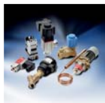
Компоненты промышленной автоматики