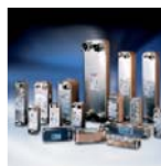
Паяные пластинчатые теплообменники

Мы являемся единственным производителем высокотехнологичных компонентов для холодильных установок и систем кондиционирования воздуха самой широкой номенклатуры. Мы предлагаем передовые технические и деловые решения, которые могут помочь Вашей компании снизить затраты, модернизировать производство и обеспечить выполнение поставленных задач.