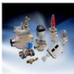
Регуляторы промышленных холодильных установок