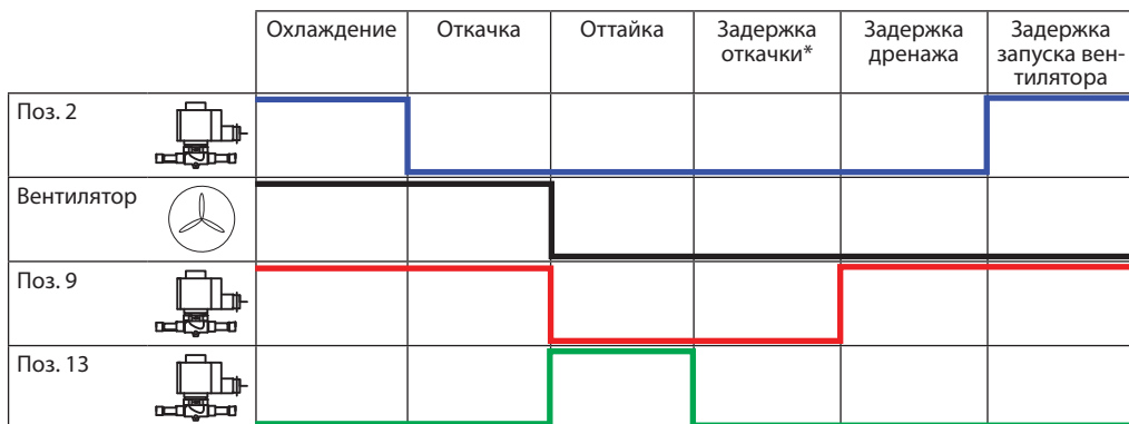
Рис. 2 Циклограмма процесса оттайки.

* В режиме «Задержка откачки» соленоидные клапаны поз. 2, 9, 13 закрыты. Байпасный соленоидный клапан на линии всасывания поз. 10 открыт.