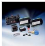
Электронные регуляторы и датчики